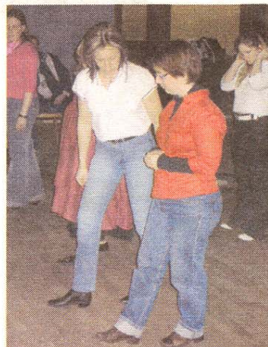
Un nouveau club est né à Neder-Over-Heembeek. ■ LST.

À NOTER Cours le jeudi de 19h30 à 21h30, 192 rue F. Vekemans, et le vendredi à Héléciné. Infos au 0475/33.62.79. Cinq euros par cours, le premier gratuit. Un t-shirt sera offert aux cinq premières personnes qui se présenteront avec l'article.